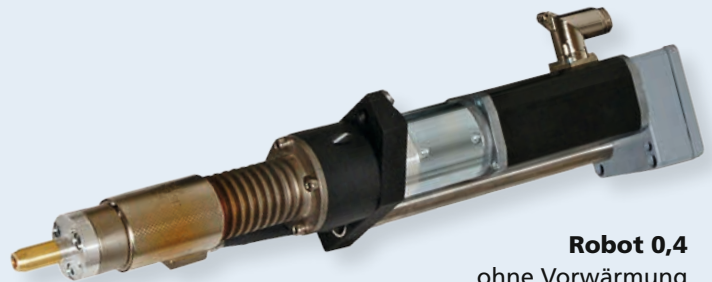
Robot 0,4 ohne Vorwärmung